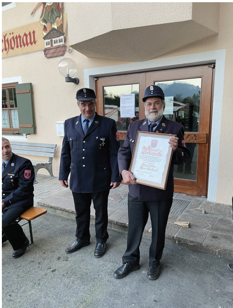
14.09.2021 Löschmeister- und Vereinsausschuss Sitzung